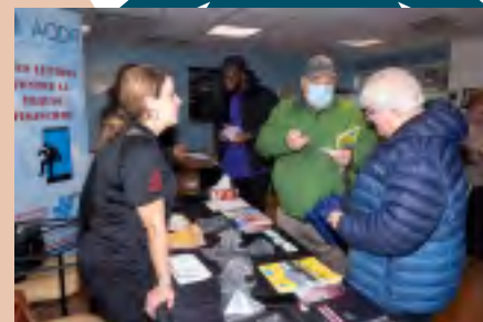
3 e édition du Salon Gériatrie sociale Saint-Laurent