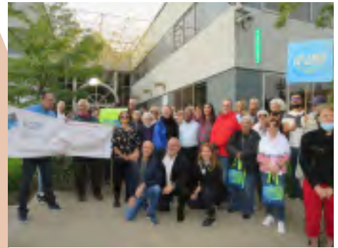
Journée internationale des aînés/COSSL